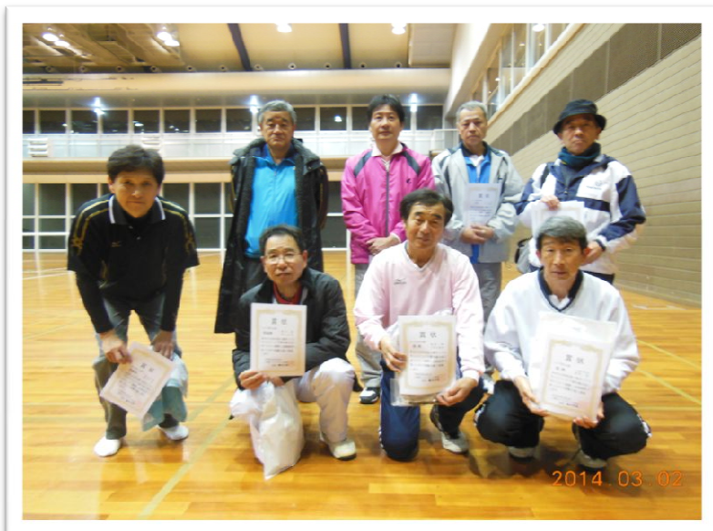
2014年インドア シニア男子入賞者