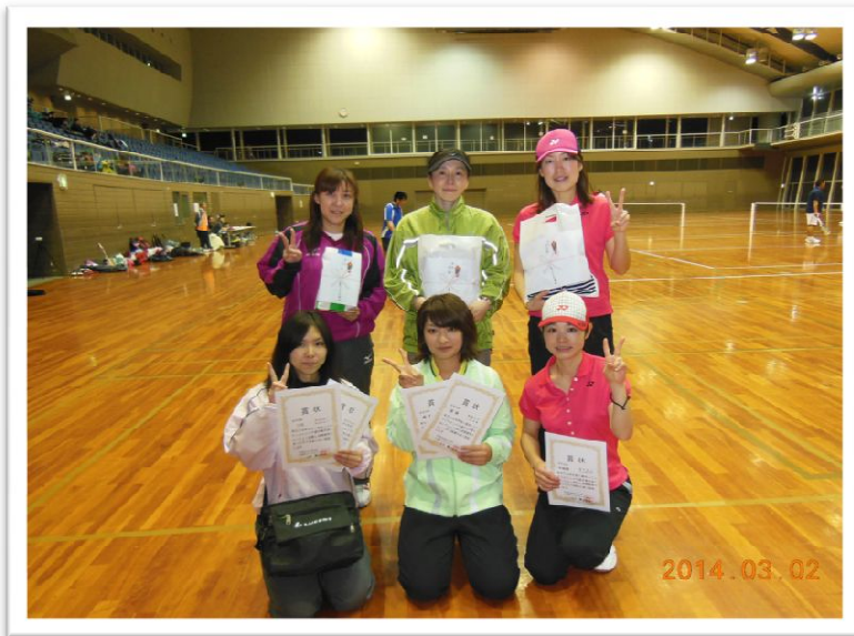
2014年インドア女子入賞者