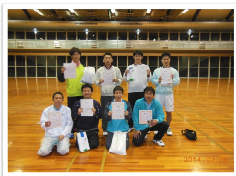
2014年インドア男子入賞者